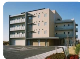
さくら保育園（事業所内保育園）