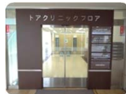
トアクリニックフロア