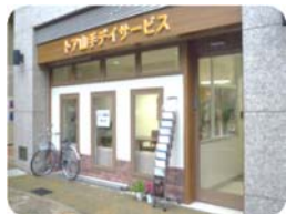
トア山手デイサービス