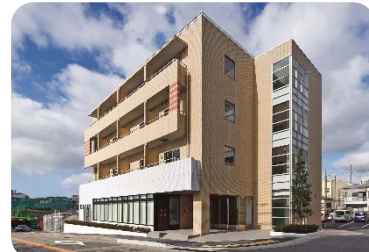
本社ビル兼高齢者住宅「大脇ハウス」